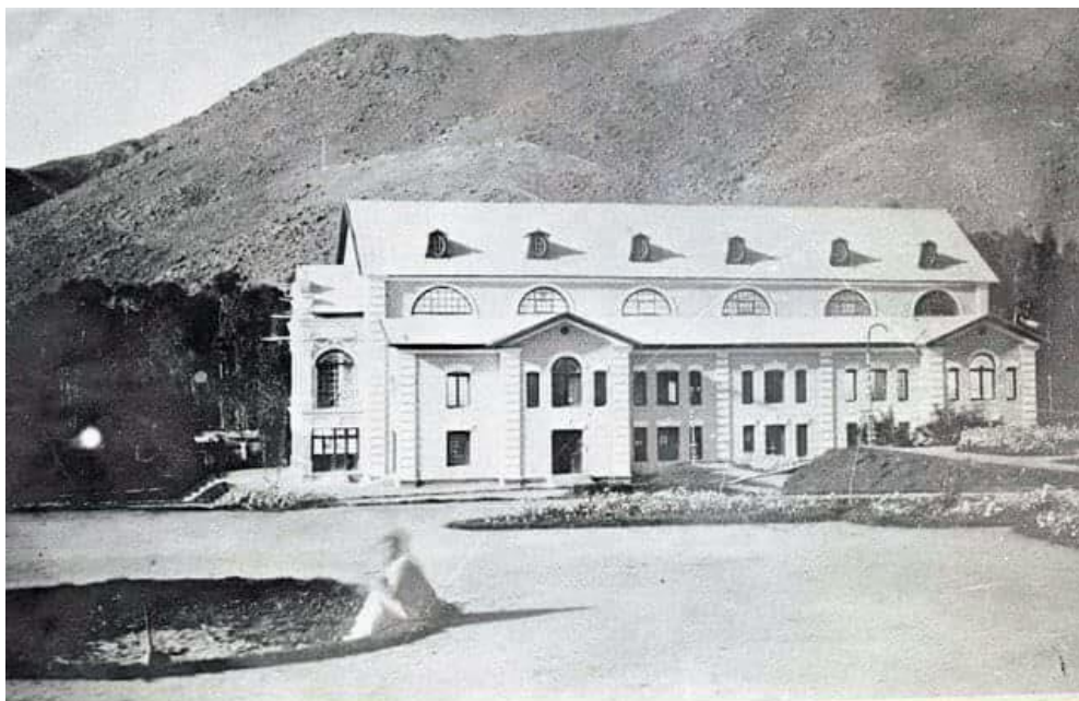
محل برگزاری لویه جرگه های 1303 و 1307 در پغمان

شاه امان الله غازی به اساس تصویب مجلس وزراء و دعوت بعضی کشورها تصمیم گرفت با ملکه برای اولین بار به خارج کشور سفر کند و از دوازده کشور آسیائی و اروپائی رسماً دیدار نماید. این سفر که بتاريخ 7 قوس 1307 ش (29 نوامبر 1927 م) آغاز و هشت ماه و چند روز را در برگرفت، بتاريخ 10 سرطان 1308 ش (اول جولای 1928 م) پایان یافت و با دست آوردهای مختلف همراه بود. طول مدت سفر پادشاه موجب شد تا لویه جرگه بجای سه سال پس از انقضای چهار سال دائر شود، لهذا جرگه بتاريخ 5 سنبله 1307 ش (29 آگست 1928 م) به اشتراک 1100 نفر در پغمان برگزار شد و بروز 9 سنبله (2 سپتمبر) به پایان رسید و به تعداد 14 نظامنامه جدید را پس از غور و تعدیلات لازم به تصویب رسانید. متأسفانه رویداد این لویه جرگه آخر عصرامانی نسبت حوادث بعدی بطور مکمل به نشر نرسید و فقط جریان مختصر آن در بعضی مآخذ تذکار یافته است.